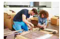
Bonus Mobili e Arredi 2020