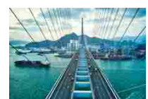
Ponti, gallerie e infrastrutture