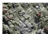
Sismabonus 2018-2021: come funziona la detrazione