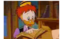
Esame di Stato Ingegneri 2020