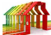
Ecobonus 2020: detrazione 65% per l'efficienza energetica