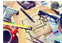
Esame di Stato Architetti 2020