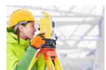
Esame di Stato Geometri 2019