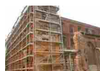
Detrazione 50% Ristrutturazioni per tutto il 2020

Il PNCS sarà a tutti gli effetti una piattaforma per il conferimento dei dati di classificazione sismica delle costruzioni per poter usufruire alle detrazioni previste dal Sismabonus . Servirà anche per verificare l'applicazione delle linee guida, e sarà molto utile per ottenere una stima delle relative agevolazioni.