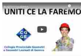
Video_messaggio dei geometri genovesi: #UNITI ce la faremo