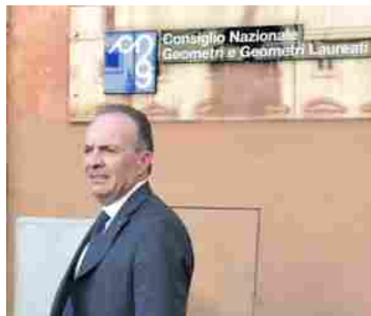
Maurizio Savoncelli | Presidente Consiglio Nazionale Geometri e Geometri Laureati

È trascorso poco più di un mese dalla chiusura, lo scorso 4 marzo, di scuole e atenei in tutta Italia, prima tappa della progressiva "messa in quarantena" voluta dal Governo per frenare il contagio da Covid-19, resa più stringente con la sospensione di tutte le attività non strategiche fino al 13 aprile (per ora).