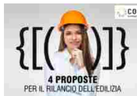
I quattro punti Cortexa per il rilancio dell'edilizia