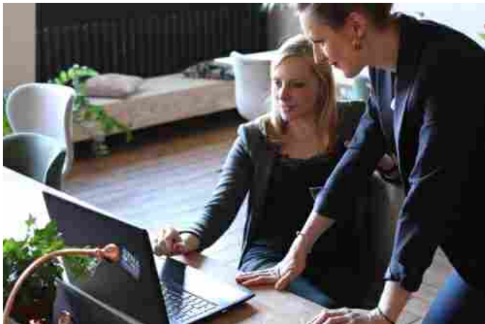
Stati Generali, professioni in campo per ripresa economica dell'Italia

Venerdì, 19 Giugno 2020 23:59 Scritto da Davide Lacangellera dimensione font - +