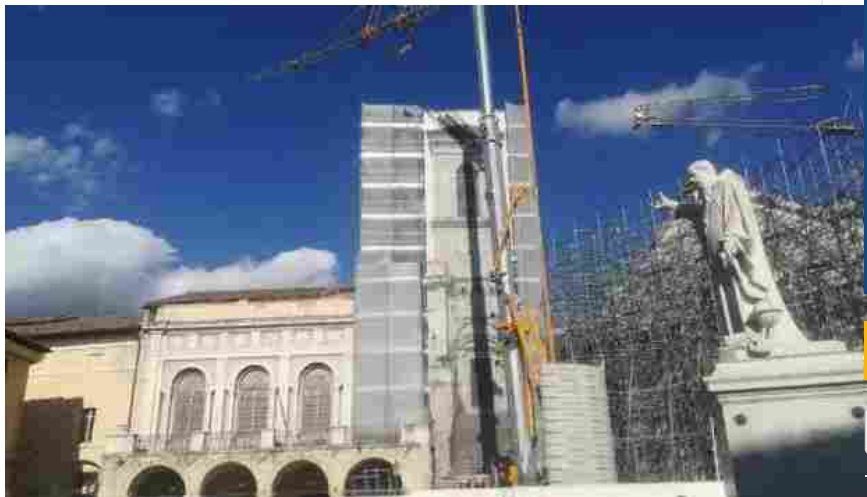
La ricostruzione a Norcia