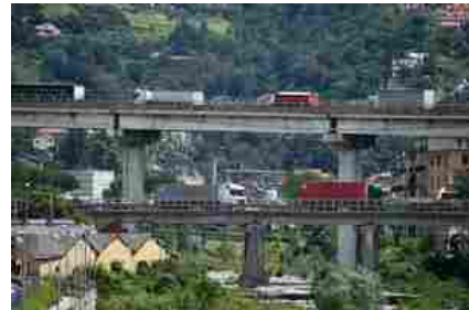
- RIPRODUZIONE RISERVATA

(ANSA) - ROMA, 08 LUG - "Ricorrere a deroghe così ampie sull'applicazione delle norme vigenti, può essere giustificato solo in condizioni di particolare urgenza, come nel caso del crollo del Ponte di Genova, ma non può certamente costituire un modello da seguire nelle attività ordinarie. Pur riconoscendo che le Autorità competenti, i dirigenti, le imprese ed i liberi professionisti coinvolti nei lavori hanno lavorato bene, ricostruendo il ponte in meno di due anni dal crollo, bisogna ricordare che le deroghe al Codice hanno di fatto consentito affidamenti fiduciari che, a regime ordinario, finirebbero per compromettere la trasparenza e libera concorrenza, tagliando fuori dal mercato dei lavori pubblici tantissimi operatori economici".