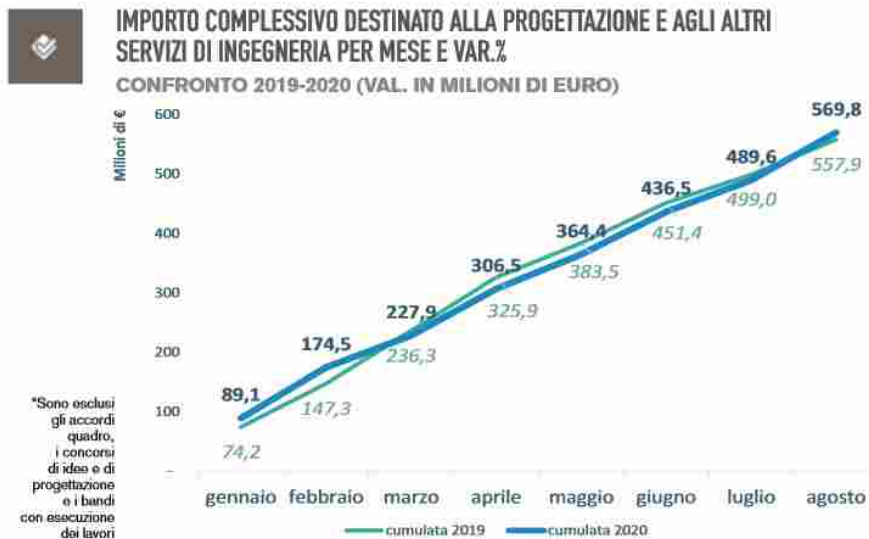
Grafico tratto dal rapporto del Centro Studi del Consiglio Nazionale Ingegneri .

Nel periodo che va dal 1° gennaio e il 31 agosto 2020 , infatti, le stazioni appaltanti hanno pubblicato gare per servizi di ingegneria per un importo a base d'asta complessivo vicino ai 570 milioni di euro , valore leggermente superiore ai quasi 558 milioni dello stesso lasso di tempo del 2019 .