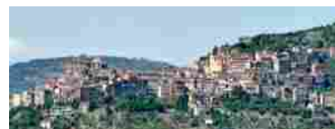
Casa a 1 euro nel Lazio, ecco il progetto di Maenza