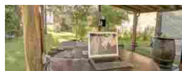
"Borgo office", lo smart working a costo zero nei borghi più belli d'Italia