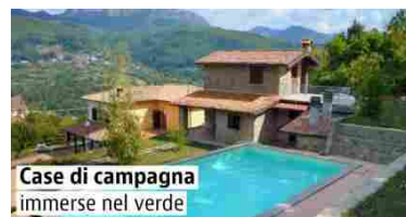
Ranking: Case rustiche in vendita