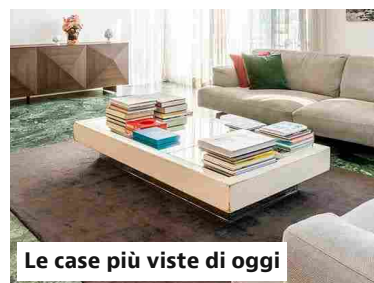
Le case più viste di oggi