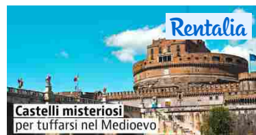
Case vacanze: 5 splendidi castelli da visitare in Italia