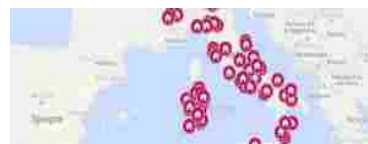
La mappa delle case cantoniere presenti nel bando Anas 2021

"L'ammissibilità degli interventi è condizionata ad un miglioramento di