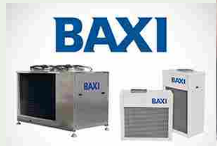
Pompe di calore aria-acqua monoblocco

A tale Nucleo centrale sono stati affiancati i Nuclei territoriali di monitoraggio, aventi il compito di effettuare un primo screening delle segnalazioni che denunciano la mancata applicazione dell'equo compenso, trasmettendo al suddetto Nucleo centrale quelle ritenute meritevoli, in modo da consentire al Ministero della Giustizia di segnalare - a sua volta - le violazioni riscontrate all'Autorità garante per la concorrenza, sollecitando i diretti interessati ad adeguarsi alla normativa vigente e intraprendendo, ove ritenuto opportuno, anche iniziative legislative a tutela del principio in questione.