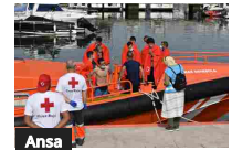
Migranti, quattro dispersi a sud delle Canarie