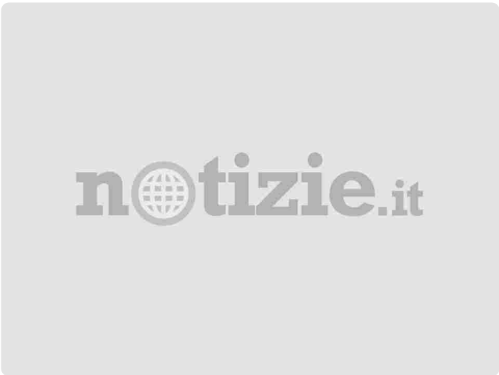
default featured image 3 1200x900

Roma, 18 feb. (Adnkronos/Labitalia) - "Bloccare le frodi sì, bloccare i cantieri no". Sul Superbonus, i partecipanti al Tavolo delle libere professioni di architetti e ingegneri si dichiarano "pronti alla massima collaborazione" con il governo e le forze politiche nella lotta al sistema fraudolento di cessione del credito, attivando azioni che siano "condivise e comuni al fine di raggiungere obiettivi concreti e certezze professionali".