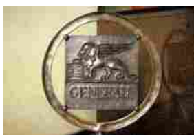
Generali guarda ai gestori Usa