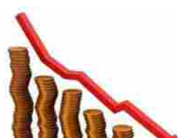
Le imprese fiutano l'uragano