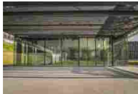
Geze. Un headquarter tecnologico e all'avanguardia nel Chianti