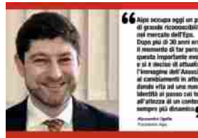
Aipe. Stessa identità, nuova immagine