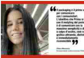
Prima. Nel punto vendita la comunicazione deve essere immediata