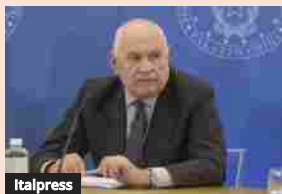
Nordio "La norma sul rave può essere perfezionata"

Articoli correlati Di più dello stesso autore