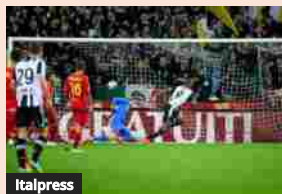
Beto risponde a Colombo, Udinese-Lecce finisce 1-1