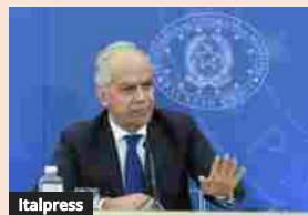
Immigrazione, Piantedosi "Ci faremo carico solo di esigenze umanitarie"