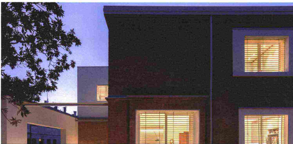
Il patrimonio edilizio da efficientare è di oltre 12 milioni di edifici ed occorre capire meglio lo stato in cui si trova