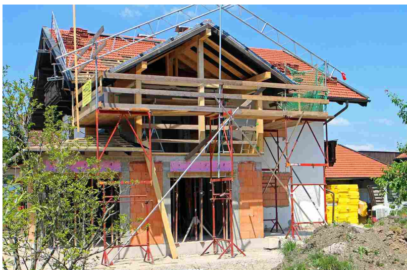
Ristrutturazione