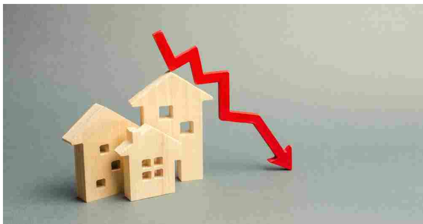
I Dati ENEA confermano: Superbonus di Aprile 2023, mai così basso

Schlein sulle riforme: «Si al confronto se è vero. Il presidente della Repubblica non si tocca» E' l'Agenzia nazionale Enea a fare un bilancio sullo stato di avanzamento delle opere e il numero di pratiche aperte sul territorio regionale (Toscana Media News)