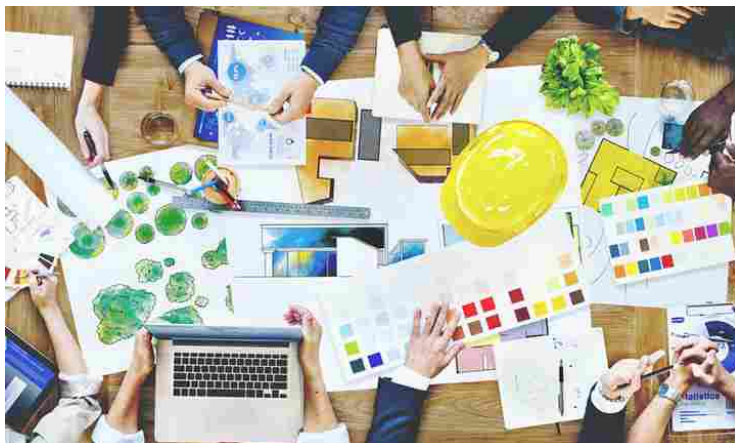
Calcolo parcella ingegneri