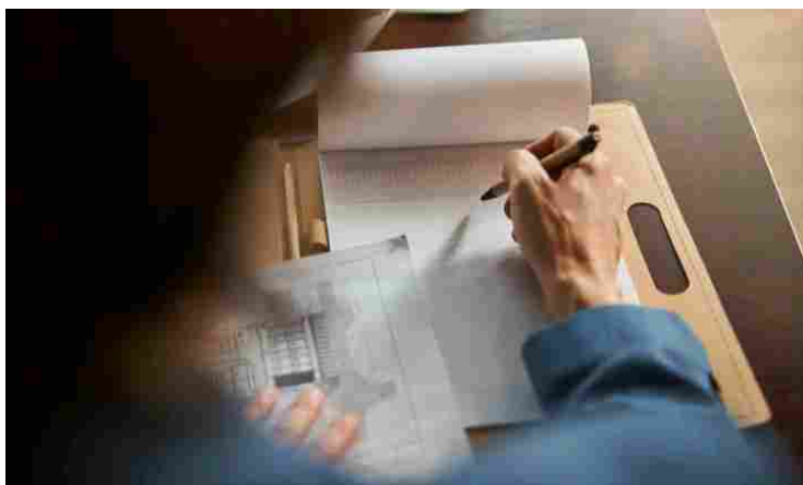
Revisione Testo Unico Edilizia

21/06/2023 - Si rimette in moto il processo di revisione del Testo Unico Edilizia, che porterà alla riforma del DPR 380/2001.