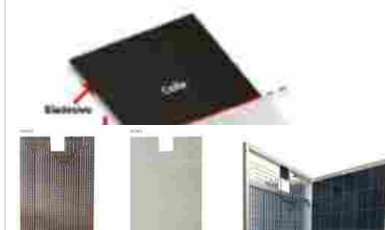
Termofotovoltaico by GDD Energy Sistemi a risparmio energetico