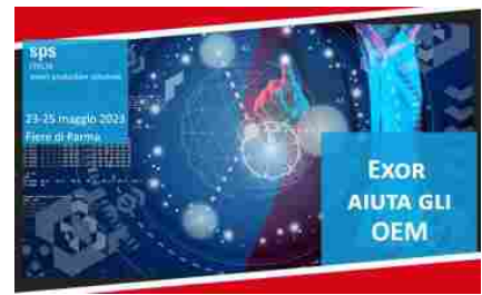
SPECIALE ITG: IL MEGLIO DI SPS 2023

Agli sprechi idrici e all'attuale situazione di siccità si aggiunge l'alto rischio idrogeologico. Secondo il Rapporto sul Dissesto Idrogeologico , in Italia il 93,9% dei comuni, pari a 7.423 su 7.905, è a rischio di frane, alluvioni e/o erosione costiera. Per affrontare questa problematica, sarebbe necessario un investimento di almeno 26,58 miliardi di euro. Queste cifre non sorprendono considerando che 6,8 milioni di persone vivono in aree a rischio medio di alluvioni e 2,4 milioni risiedono in zone ad alto rischio, il che rappresenta complessivamente il 15% della popolazione, come riportato nella scheda tecnica sul dissesto idrogeologico del Centro Studi CNI . Ci sono 2,1 milioni di edifici situati in zone ad alto e medio rischio di alluvioni, che corrisponde al 15% del totale. Questi dati evidenziano la necessità urgente di affrontare la questione del rischio idrogeologico e di allocare risorse adeguate al fine di proteggere le comunità e le infrastrutture da eventi catastrofici.