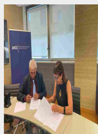
Sicurezza: ANCE e CNI rinnovano Protocollo d'intesa