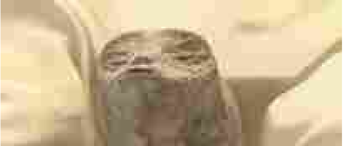
Esperto di Ufo mostra due 'corpi alieni' in Parlamento