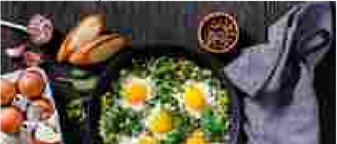
La dieta contro la stanchezza: cosa non deve mai mancare