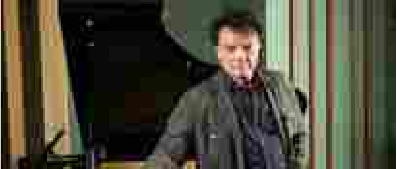
Massimo Ranieri: "Torno alla fiction dopo 20 anni!"