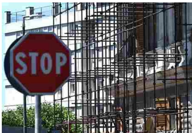
Un edificio in corso di ristrutturazione