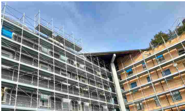
Superbonus, costi e benefici

23/02/2023 - Il superbonus è costato allo Stato 71,8 miliardi euro per riqualificare meno del 2% degli edifici