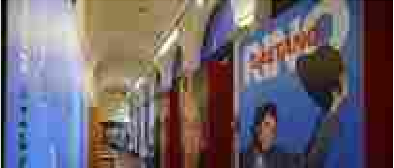
A Roma la prima mostra dedicata a Rino Gaetano