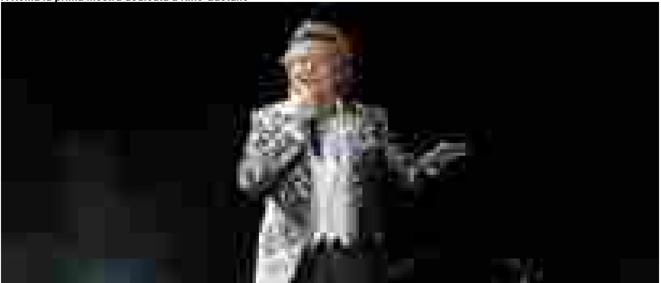
Rod Stewart vende la sua musica per 100 milioni di dollari