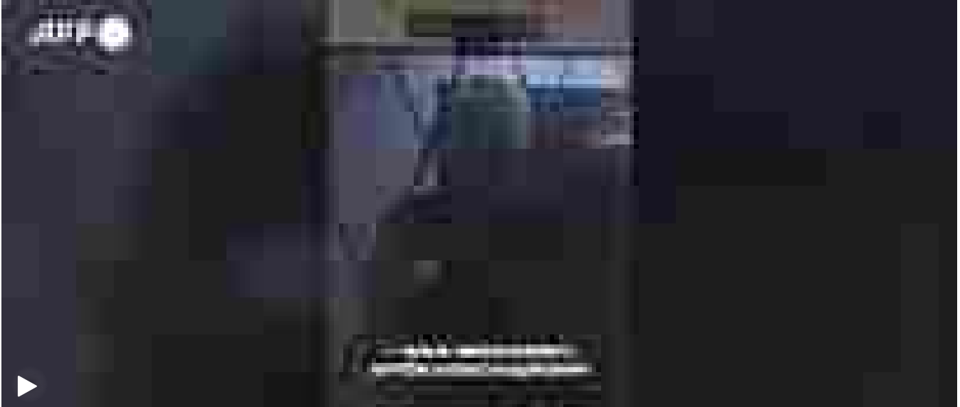
Navalny in una delle sue ultime apparizioni: 'Votate contro Putin'