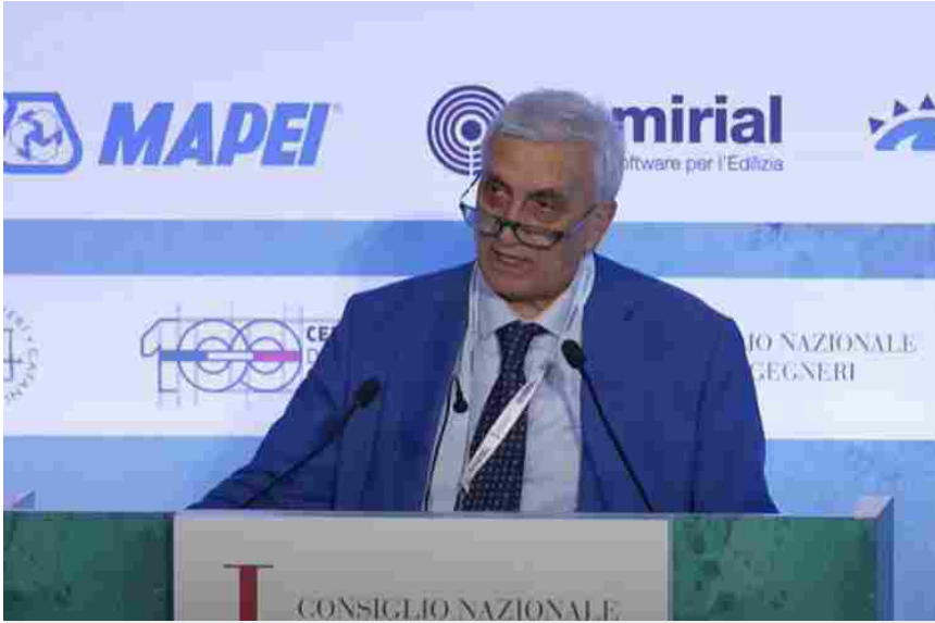
Angelo Domenico Perrini presidente del Consiglio nazionale ingegneri