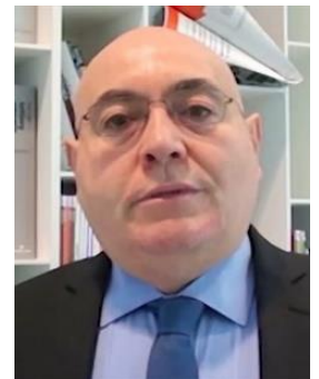
Sergio Clarelli Studio di ingegneria economica e ambientale